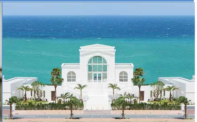
CENTLEGENDA CHAPEL 聖陶芮塔教堂 WCKA-OKAW19-11